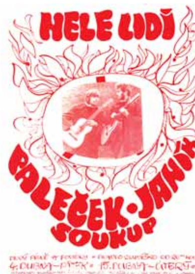
Plakát, zvoucí na recitál dvojice Paleček-Janík na jejich první domovské scéně v divadle Sluníčko.

Čas neuvěřitelně rychle letí! O tom vás jistě nemusím příliš přesvědčovat. Například dvojice písničkářů Miroslav Paleček a Michael Janík slaví v letošním roce už neuvěřitelných 40 let, kdy se dali dohromady. Jejich snad nejslavnější píseň Hele lidi , symbol křehkého povzbuzení a optimismu po invazi vojsk Varšavské smlouvy do tehdejšího Československa v srpnu 1968, oslava 40. výročí vzniku čeká v roce 2008. Patří jí tedy tento díl naší rubriky Hvězdy, které nestárnou.