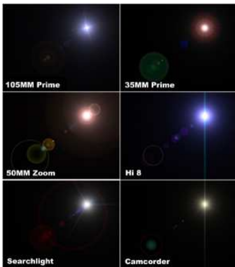
Obrázek 4: Počítačová simulace efektů objevujících se ve fotoaparátech a kamerách (ostrost, velikost i barvy jsou přehnané)