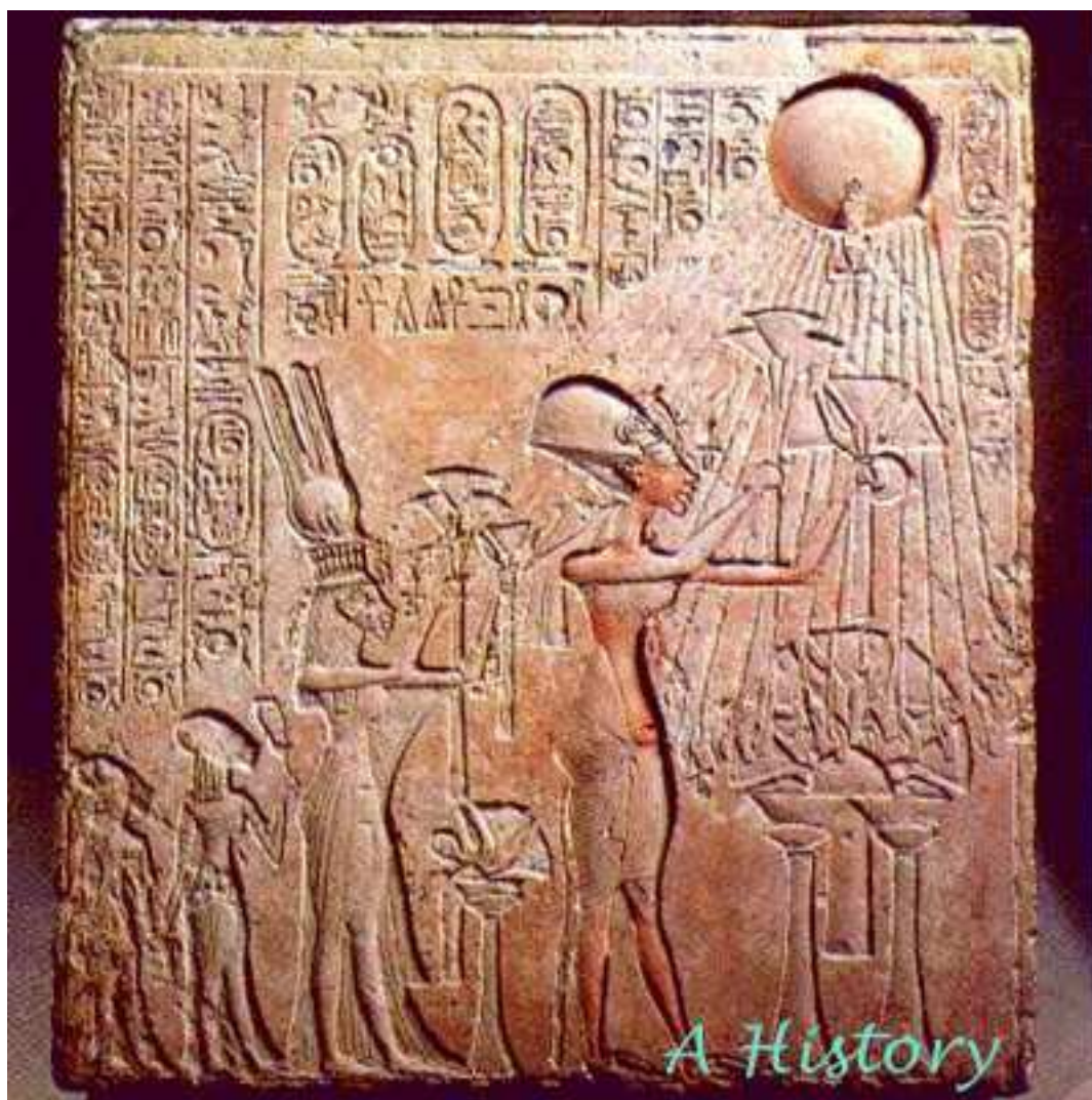
Obrázek 1: Paprsky znázorňovali již staří egyptané