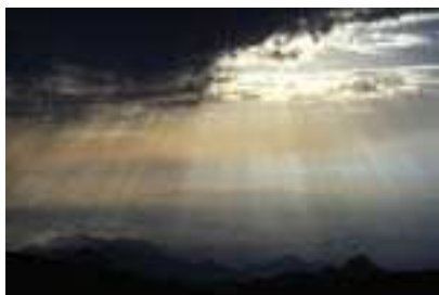
Obrázek 2: Autor [1] se snaží vysvětlit pozorování paprsků na základě efektů viditelných v atmosféře