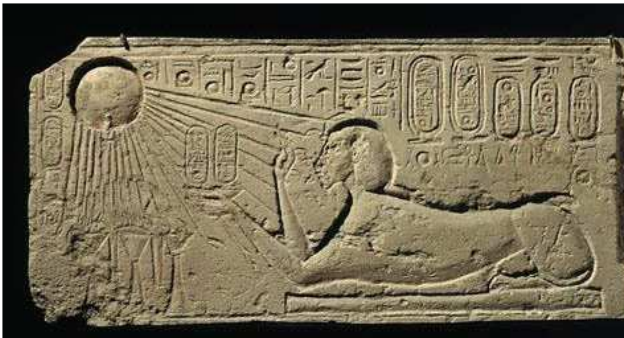
Obrázek 3: Egypťané paprsky v posvátných rytinách kreslili zřejmě právě proto, že se jim zdálo, jakoby se za nimi ze slunce natahovaly.